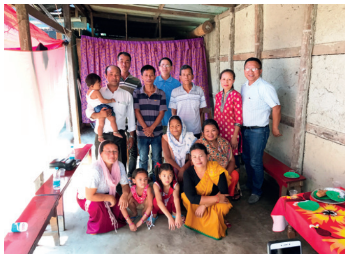
Ds Lawr bij een churchplant

Als gereformeerd predikant geloof ik dat we in gezamenlijkheid aan het bevel van Christus de verantwoordelijk-