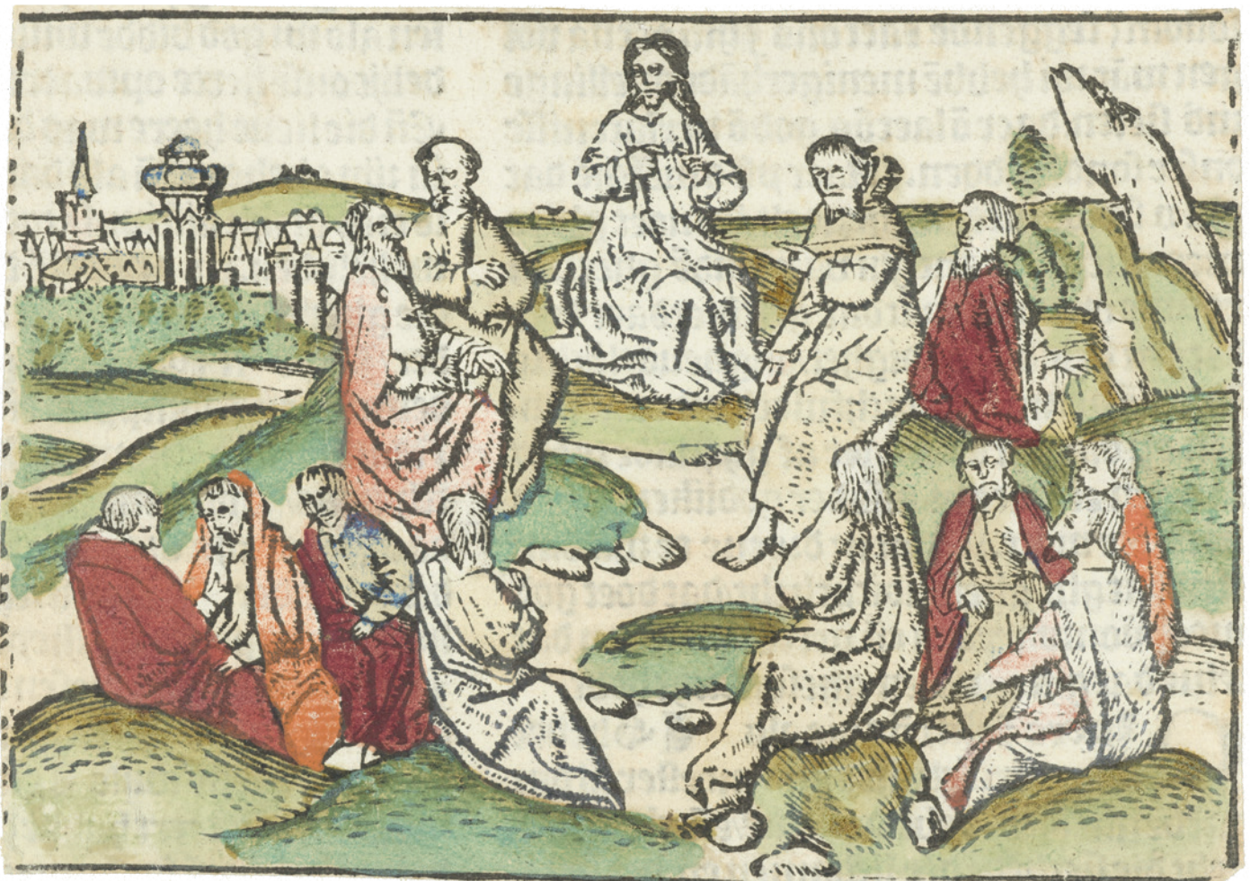
Meester van Haarlem, Christus met zijn leerlingen , 15e eeuw

'Wie zeggen de mensen dat ik ben?' 'Wie denken jullie dan dat ik ben?' (Matteüs 16:13 en 15) ▶